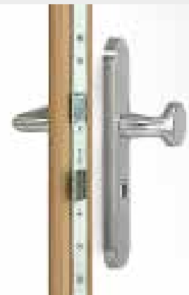
DREI-BOLZEN-SICHERHEITSSCHLOSS alternativ: Drei-Bolzen-Sicherheitsautomatikschloss, Bolzen schließen automatisch (ohne Schlüssel) bei geschlossener Tür