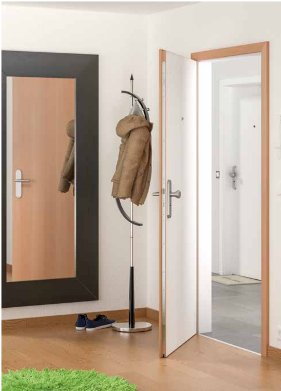
WOHNUNGSEINGANGSTÜR Bandgegenseite (außen): Weißlack, Bandseite (innen): Buche natur, Überschlafdichtung, Weitwinkelspion, Drei-Bolzen-Sicherheitsschloss, ES1-Sicherheitsgarnitur mit Zylinderabdeckung, Zarge Standard kantig

Wohnungseingangstüren (WE) - auch genannt Wohnungsabschlußtüren (WAT) - von Köhnelein aus hochwertigsten Materialien gefertigt und mit einer maßgerechten Ausstattung versehen, z.B. Drei-Bolzen-Sicherheitsschloss, ES1-Sicherheitsgarnitur mit Zylinderabdeckung, absenkbare Bodendichtung .